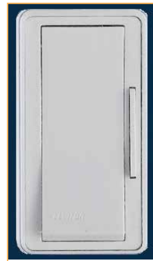
Interrupteur lumineux de type à bascule