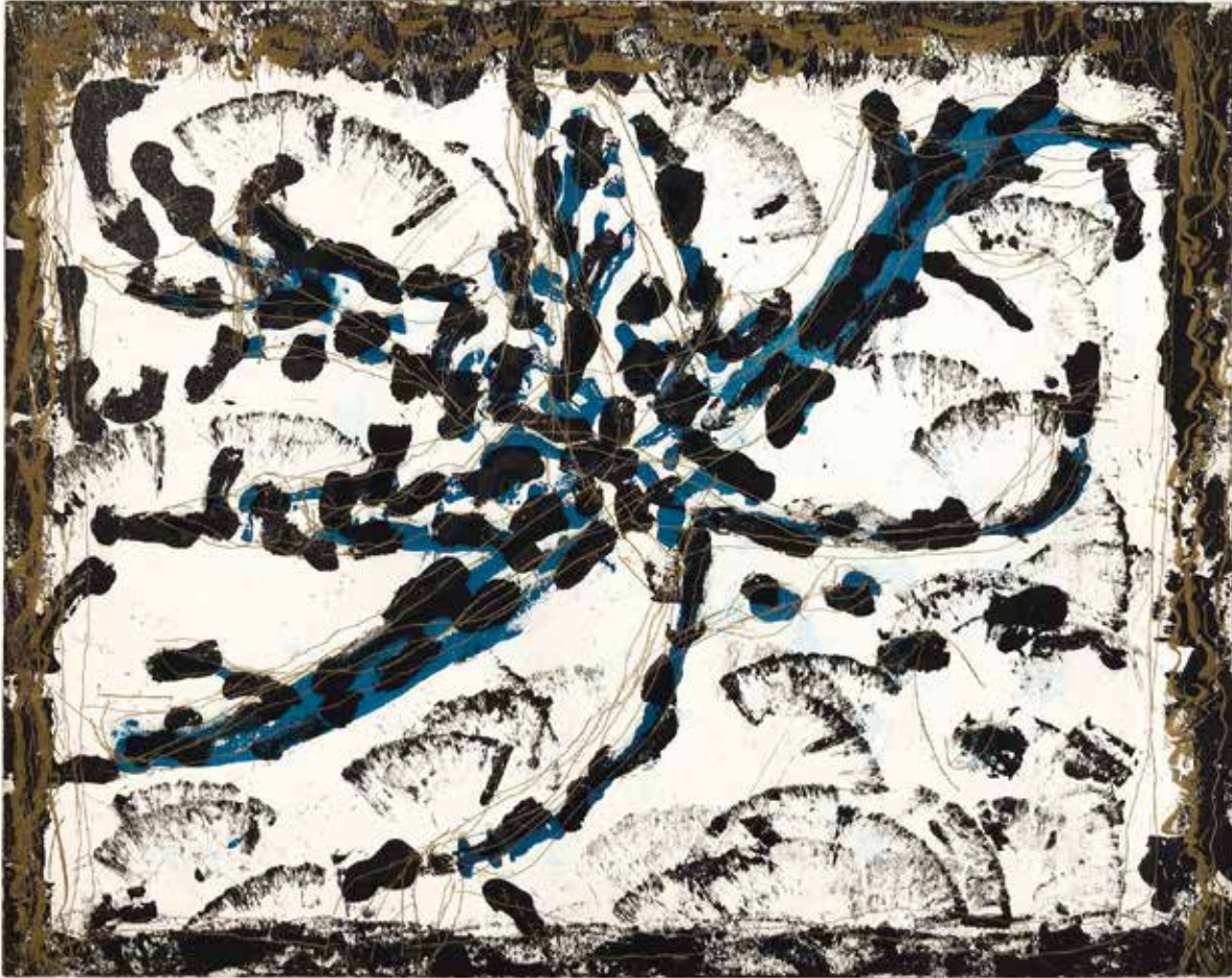
Jean Paul Riopelle, Les mouches à marier , 1985, eau-forte sur papier Arches, 50 x 65,5 cm, collection Ville de Gatineau, © Succession Jean Paul Riopelle / SOCAN (2023).