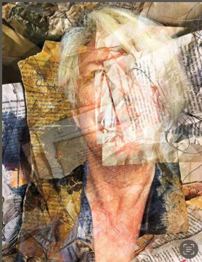
Josée Prud'homme, Les Femmes-livres VIII , estampe numérique, 2018.