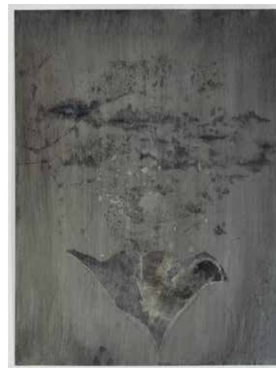
Hélène Lord, Ruissellement (triptyque, détail), encre, acrylique et collages sur papier, 60 x 40 cm, 2018.

Hélène Lord observe, mesure, trace la portée des jours. Son regard s'attache à l'environnement; au détour d'un dessin, dans une sculpture ou une installation, un arbre, un buisson, une forêt s'élèvent, un paysage se déploie.