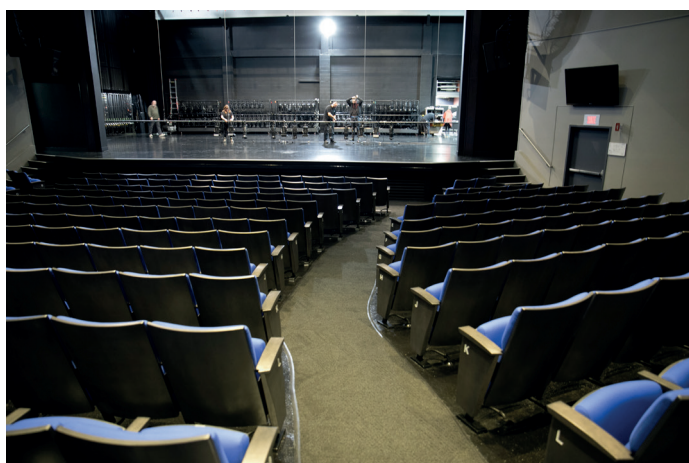
Description : pente menant à la scène avec bande lumineuse de chaque côté, Maison de la culture, secteur de Gatineau