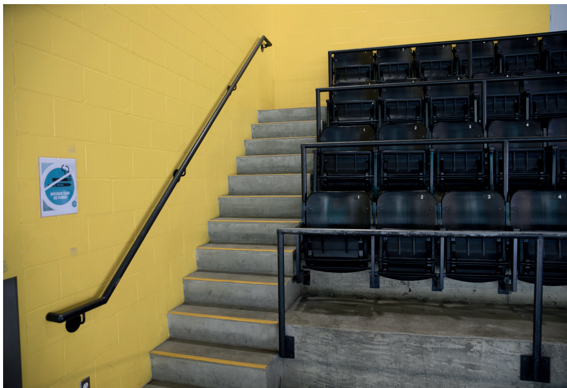
Description : Le premier siège de chaque rangée est de grand format conçu pour les personnes de forte taille, centre sportif de Gatineau, secteur de Gatineau