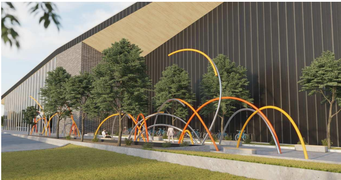
Vélocité d'Hélène Rochette Centre sportif Girardin – Drummondville