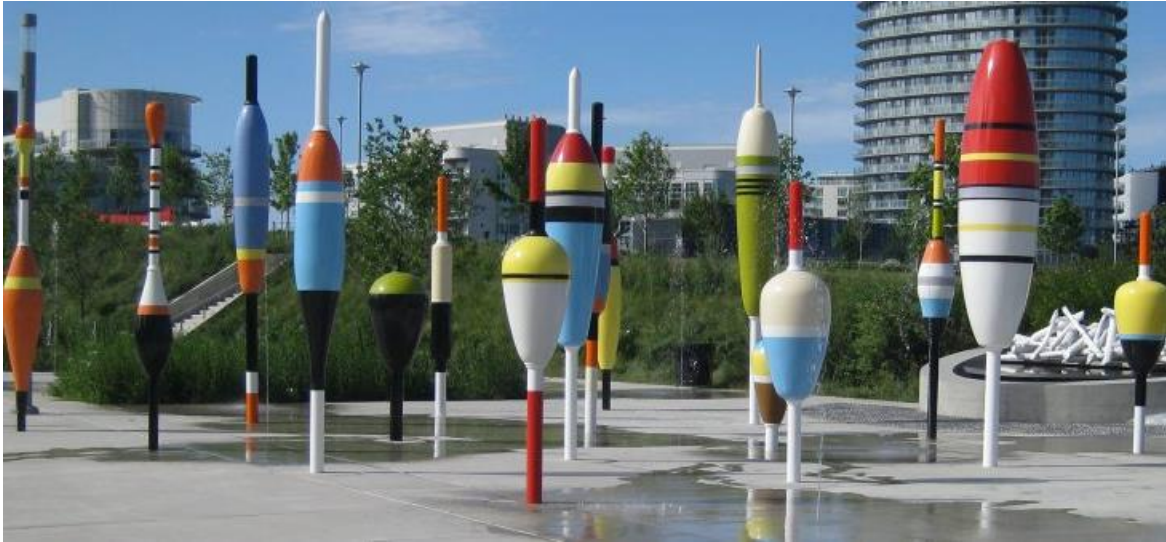
Float Forms de Douglas Coupland Bobber Plaza – Toronto