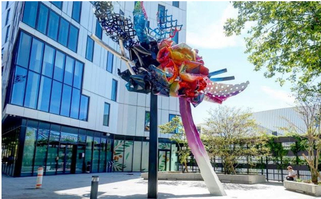
The Beautiful Dreamer d'Arne Quinze Porte de Versailles – Paris