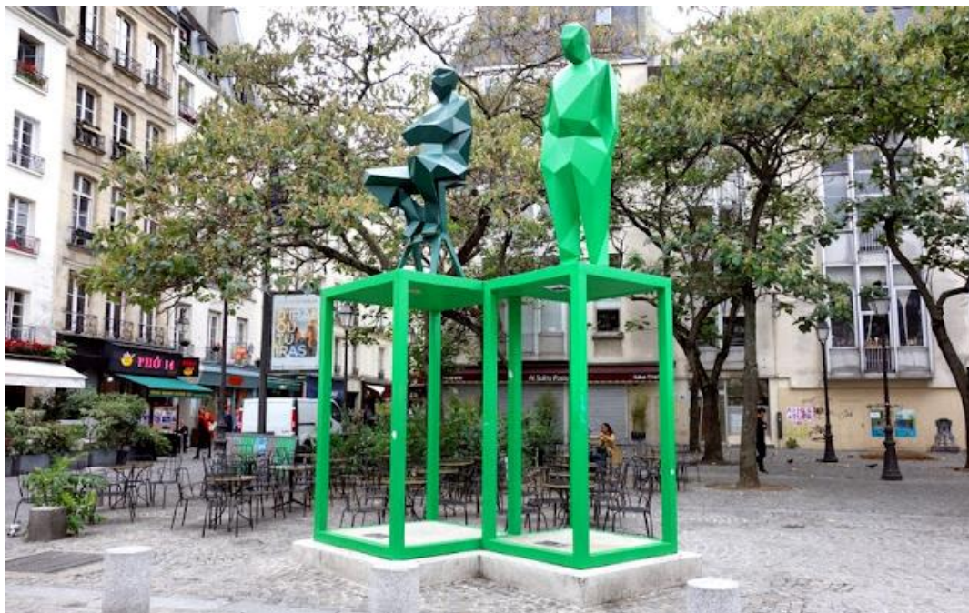
Renzo Piano et Richard Rogers de Xavier Veilhan Place Edmond Michelet - Paris