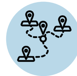
VISITE AUTONOME DU TERRAIN