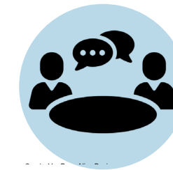
DISCUSSIONS EN TABLE RONDE