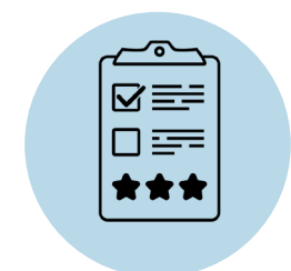
CONSULTATION EN AUTONOMIE