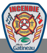
SCHÉMA DE COUVERTURE DE RISQUES EN SÉCURITÉ INCENDIE