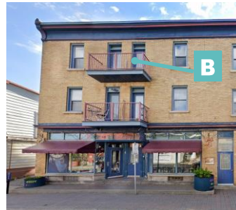
Édifice mixte avec balcon en encorbellement 86-90, rue Eddy Street View