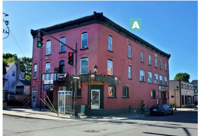
Édifice mixte avec un plan rectangulaire 167, rue Eddy Enclume