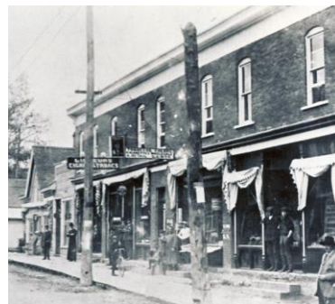
Édifice mixte à toit plat à Buckingham 488, avenue de Buckingham Ville de Gatineau