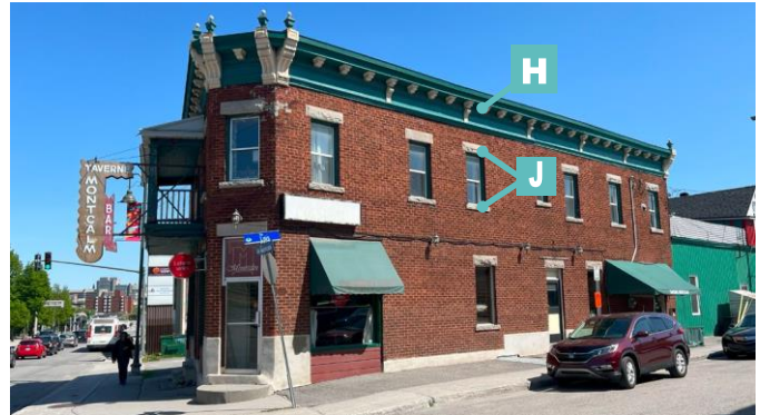
Édifice mixte à toit plat avec corniche ornementée 225, rue Montcalm Enclume