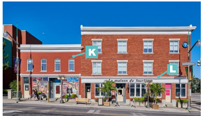
Édifice mixte à toit plat avec entablement 97-101, rue Laurier Ville de Gatineau