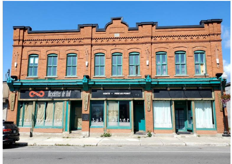
495, avenue de Buckingham Enclume

Tout comme la maison en brique à toit plat, ce type est lié à l'évolution technologique des méthodes de construction et, surtout, à l'industrialisation des matériaux. Ainsi, l'avènement des structures de type Balloon Frame , ou charpente à claire-voie, à la fin du 19 e siècle permet une construction plus rapide avec des matériaux standardisés, tels que les montants de bois qui composent ce genre de charpente. L'apparition des membranes étanches recouvrant les toitures dans les années 1910 et 1920 aura aussi un impact sur la construction de ce type bâti en permettant des pentes de toit plus faibles pour l'écoulement des eaux.