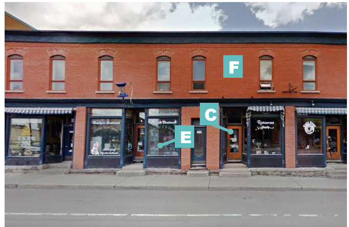
Édifice mixte à toit plat avec vitrines de part et d'autre des portes d'entrée en retrait 498, avenue de Buckingham Street View