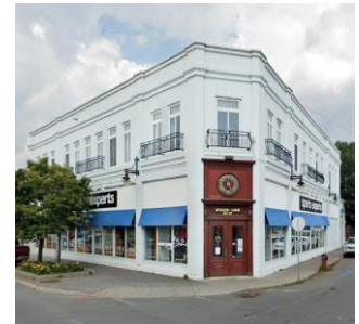
Édifice mixte avec un plan trapézoïdal 444, avenue de Buckingham Street View