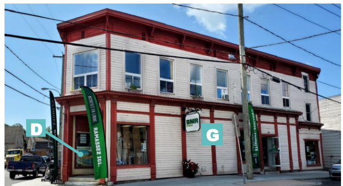
Édifice mixte en bois 118-120, rue Joseph Enclume