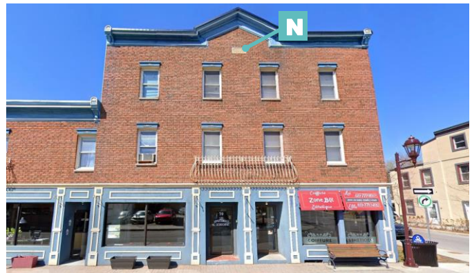
Édifice mixte à toit plat avec vitrines 79-81, rue Eddy Street View