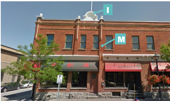
Édifice mixte à toit plat avec entablement et parapet 79-83, rue Principale Street View