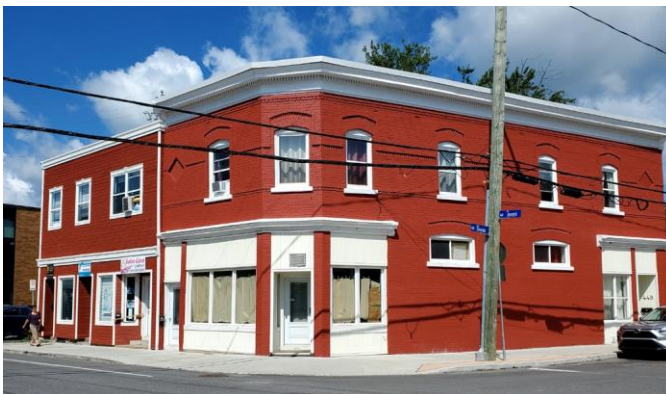
Édifice mixte à toit plat avec jeux de brique 119, rue Joseph Enclume