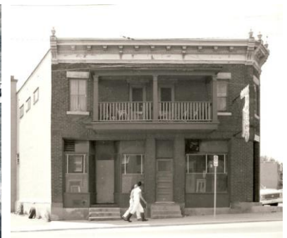
Édifice mixte à toit plat à Hull 225, rue Montcalm Ville de Gatineau