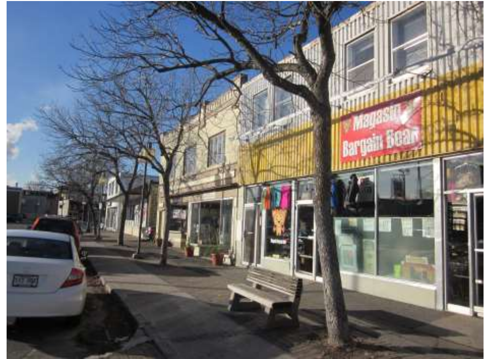
Rue Notre-Dame, 2014