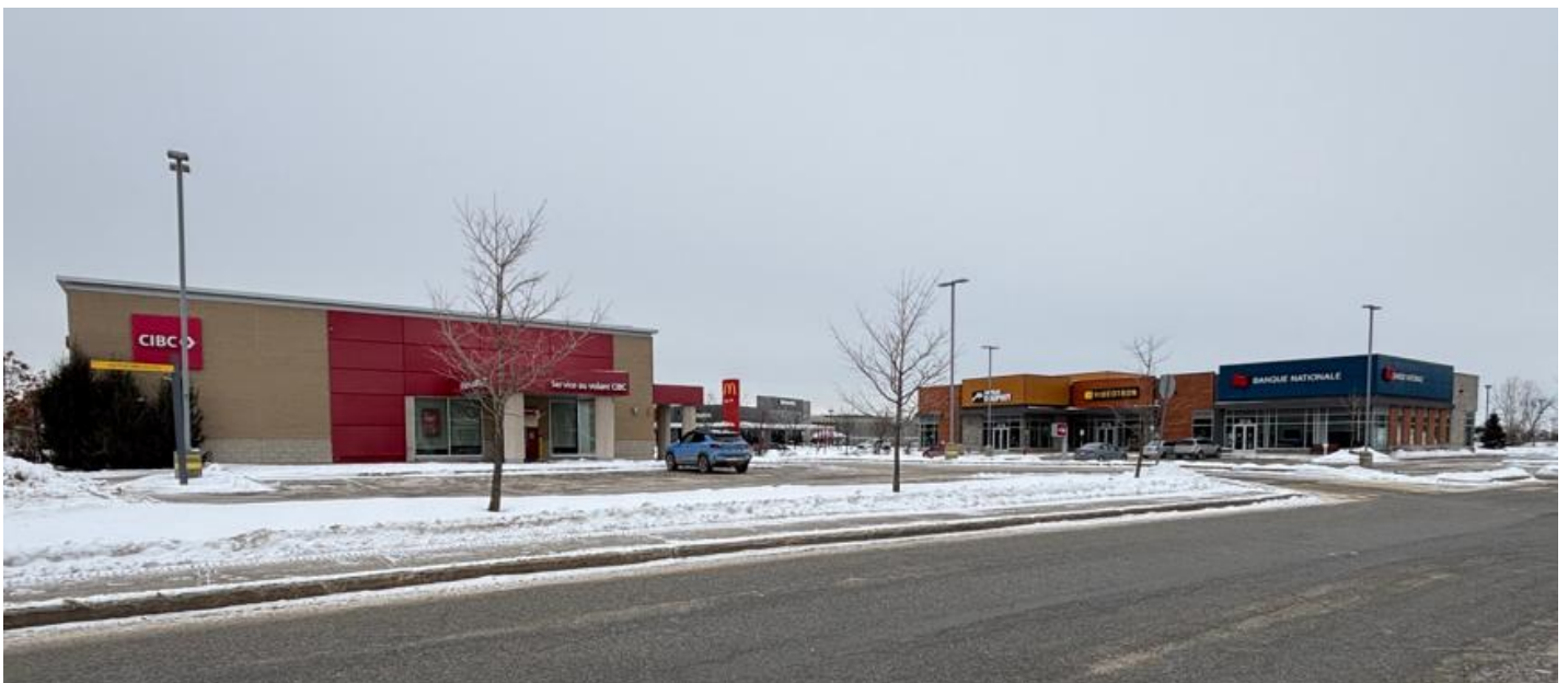
Photos du site

Google Earth le 8 juillet 2024 et SUDD - 25 janvier 2026 235, boulevard des Grives